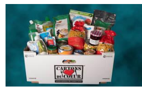
Les cartons du cœur

Les bonnes idées pour faire des économies