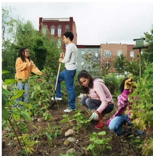
4 - Jardiner ensemble