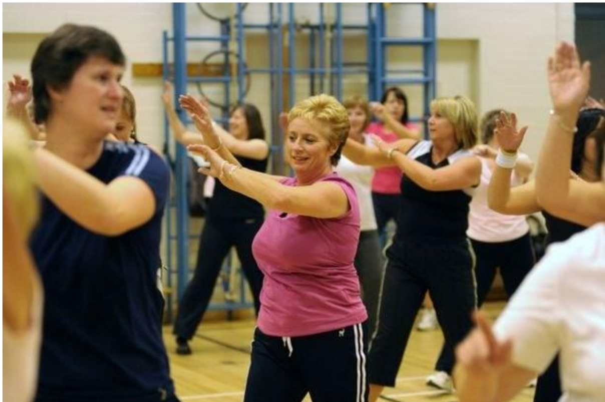
10 - Faire une activité sportive