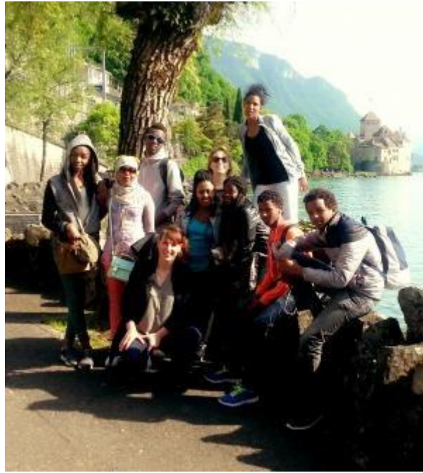
7 - Visiter le pays