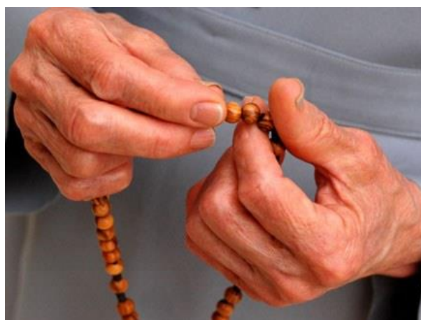
13 - Pratiquer ma religion