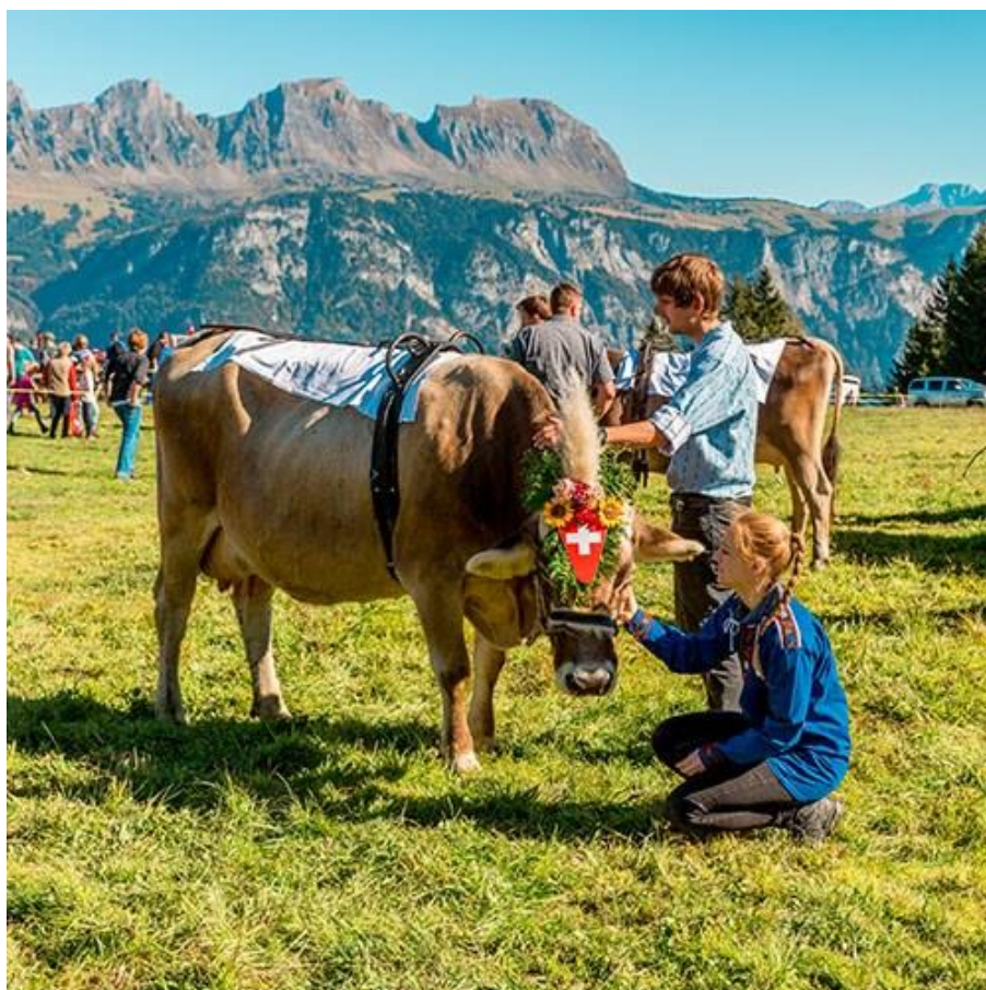
3 - Connaître les traditions Suisses