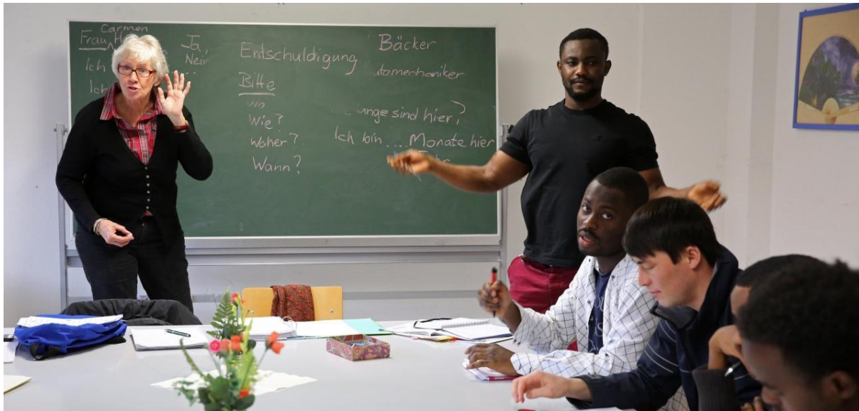
9 - Apprendre le français