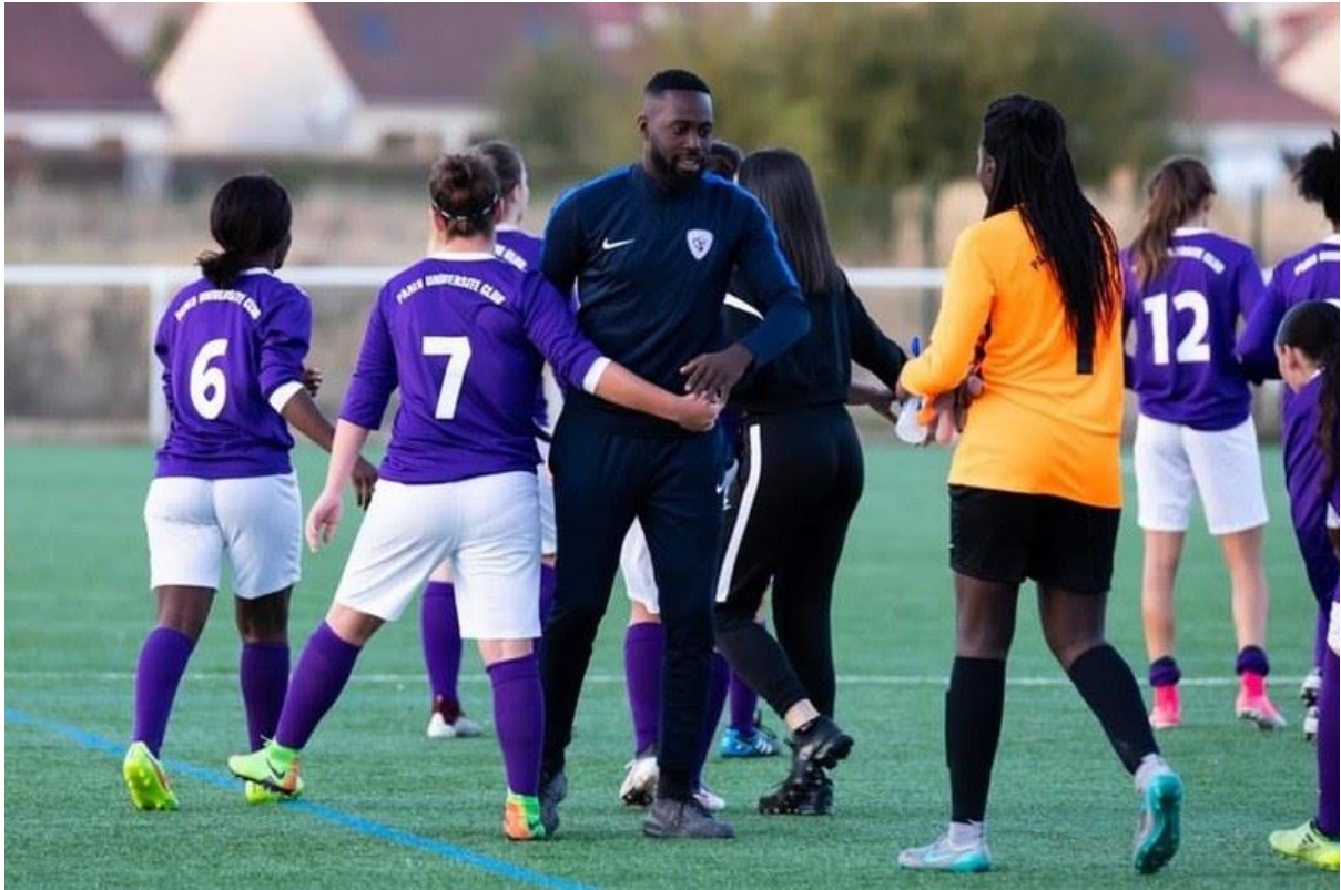
14 - Faire parti d'une équipe