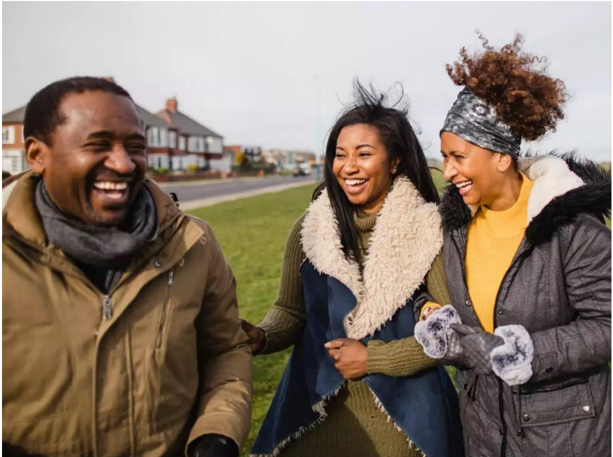
1 - Avoir des amis