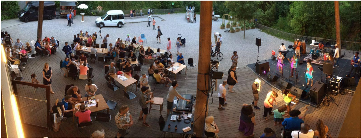
11 - Participer à des activités culturelles