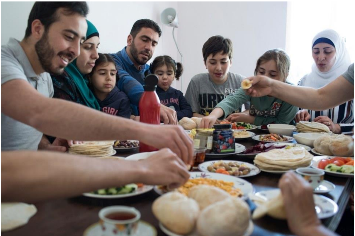
2 - Partager le repas