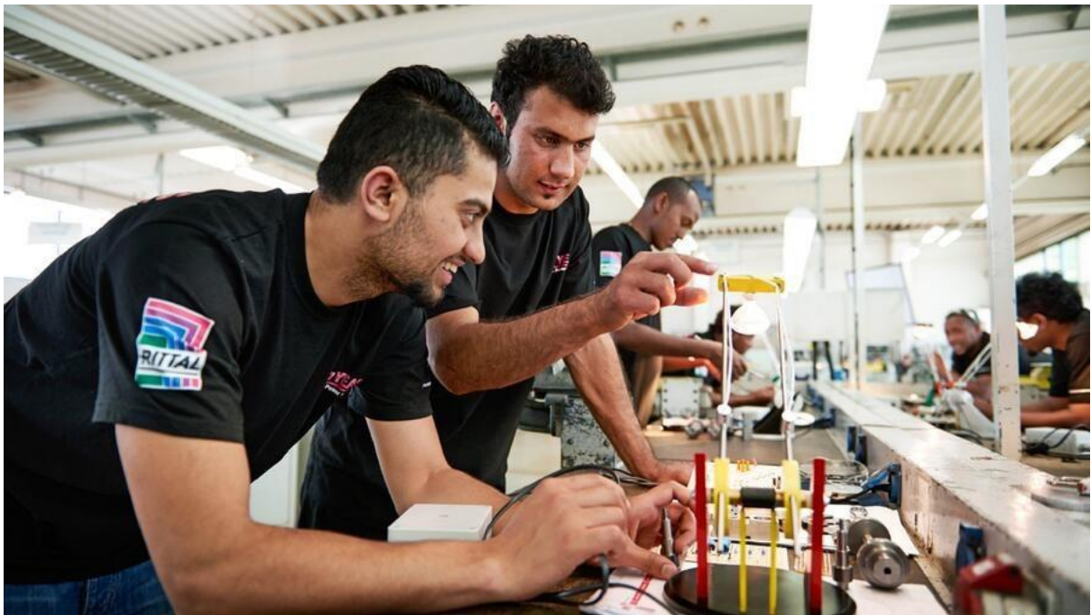
6 - Travailler