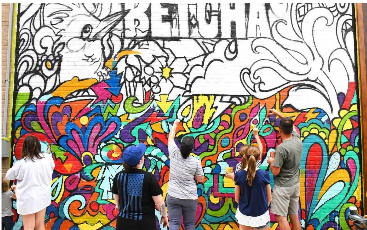
12 - Participer à un projet dans la communauté