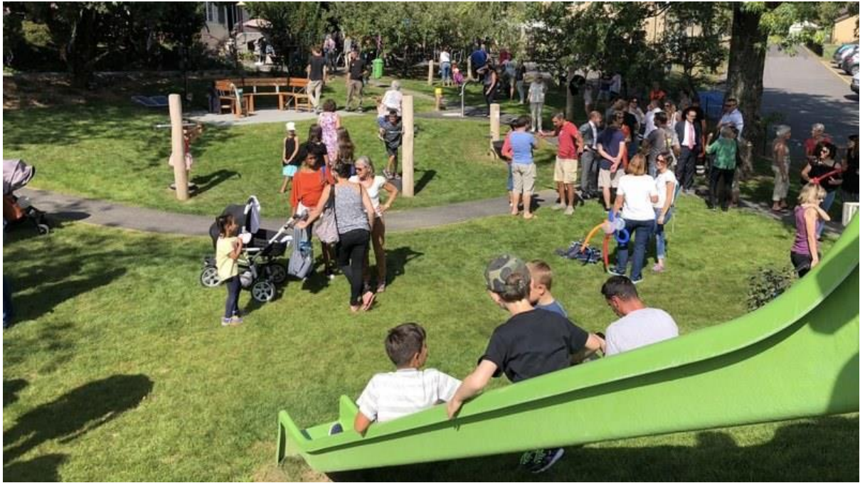
5 - Participer à la vie dans mon quartier