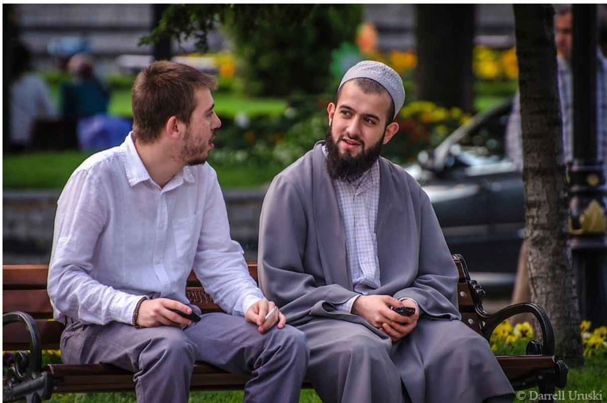
8 - Faire connaissance avec des gens de différentes cultures